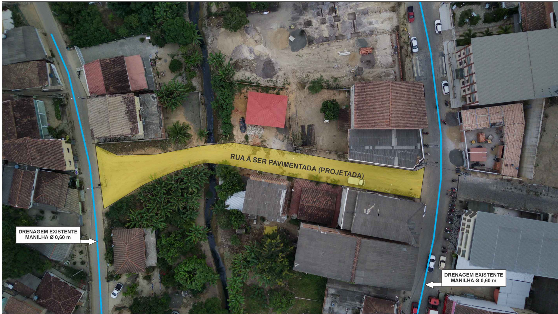
1 FOTO AÉREA SEM ESCALA